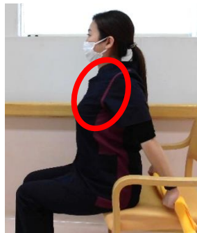
胸ストレッチ 胸を張る