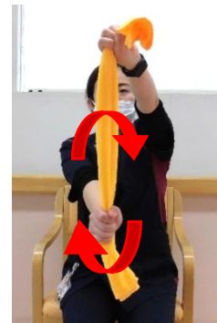
ハンドル握り 腕を上下に回す