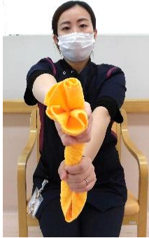
雑巾絞り 左右入れ替えて