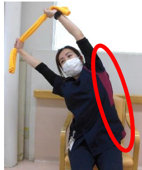
わき腹ストレッチ 左右脇腹を伸ばす 各10回