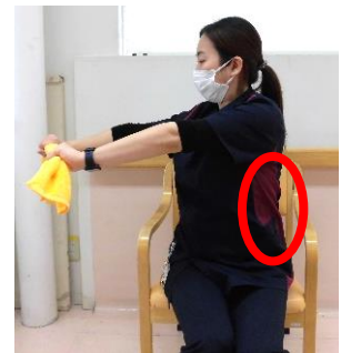
ウエストねじり 上半身を左右ねじる 各10回