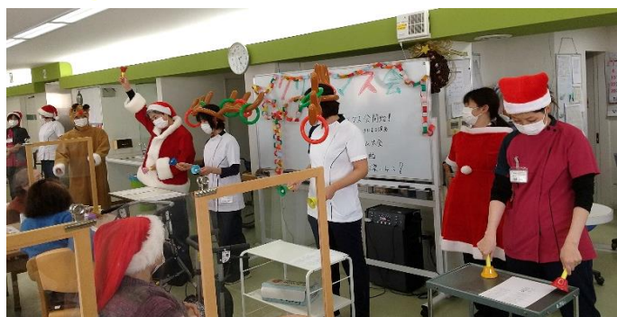
職員によるハンドベル演奏♪