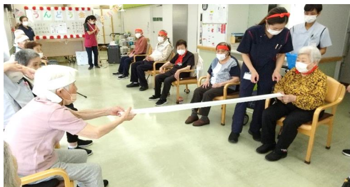
トイレトペーパー綱引き