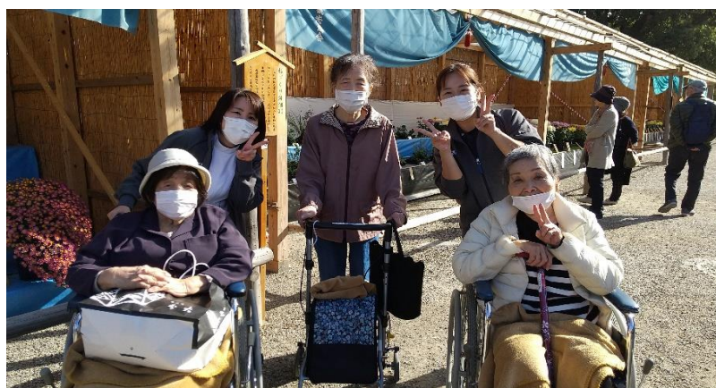
穏やかな天気にもなりました