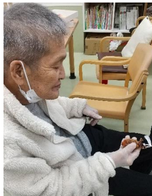
柿をもみもみ 味がよくなりますよ