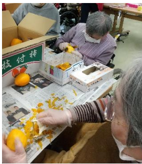
包丁さばきは さすがです