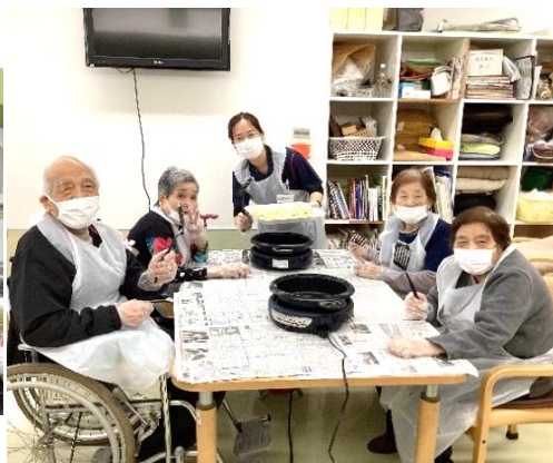
ホットケーキ作り