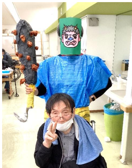
すっかり鬼と仲良し♪