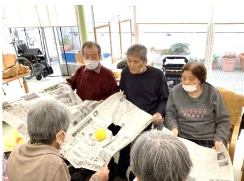
落とさないように、、、 協力して次の方へ