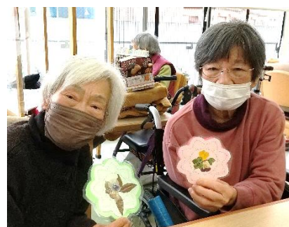
育てた花で 可愛く出来上がり