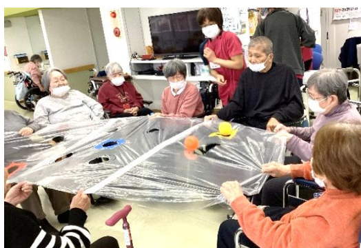
今度は、同じ色の穴に落ちるかな!?