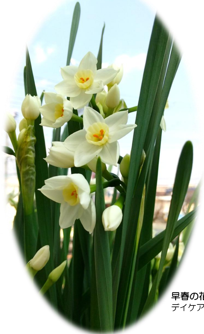
早春の花～スイセン～ デイケアで利用者様と一緒に育てました

ふくやま・すこやかクリニック通所リハビリテーション Tel(078)927-1522 明石市野々上3丁目15-19 Fax(078)927-1517