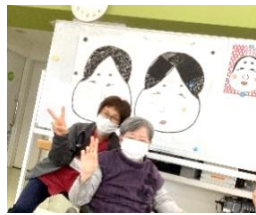
右右→!! 左左←!! 可愛いお顔♪の出来上がり