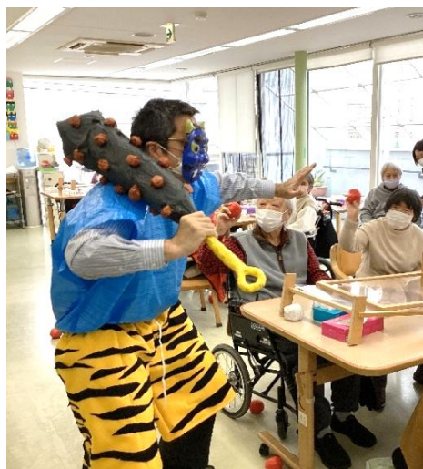
鬼は外!! 福は内!! 福よ来い カいっばい鬼退治