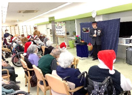
12月24日 明石きらきらマジッククラブさんの マジックショー☆