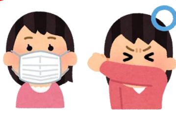
マスク・咳エチケット