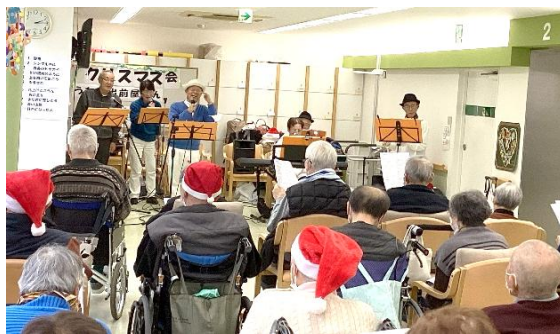
12月25日 うたの出前屋さんの演奏会♪