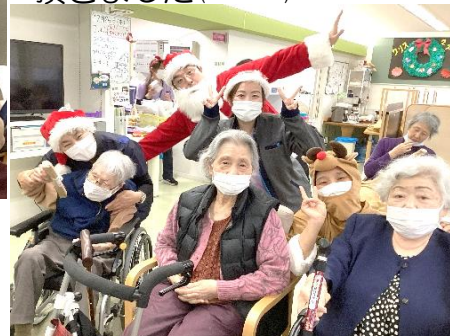
サンタさんからプレゼントを 頂きました(*^-^*)