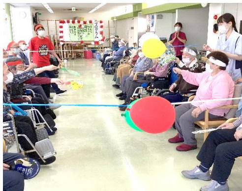
風船パタパタゲーム