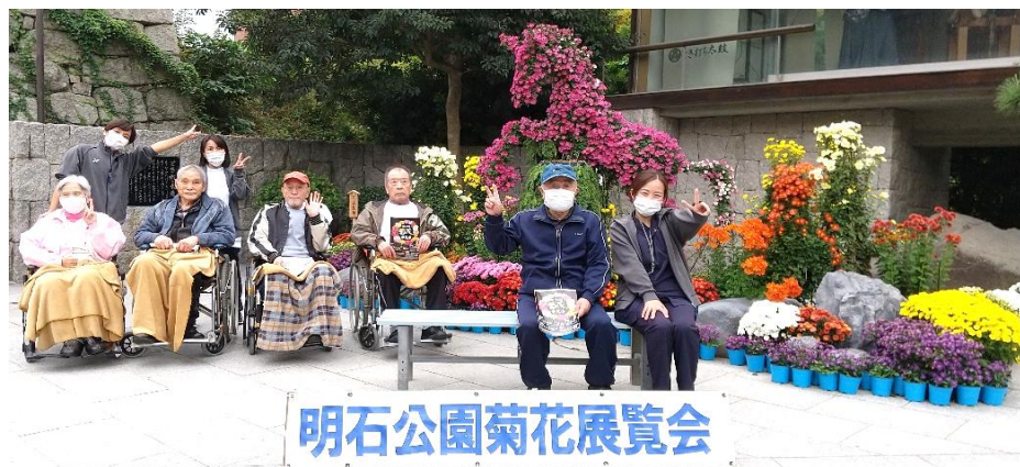
見事な菊の芸術に触れ、豊かな時間を過ごしました